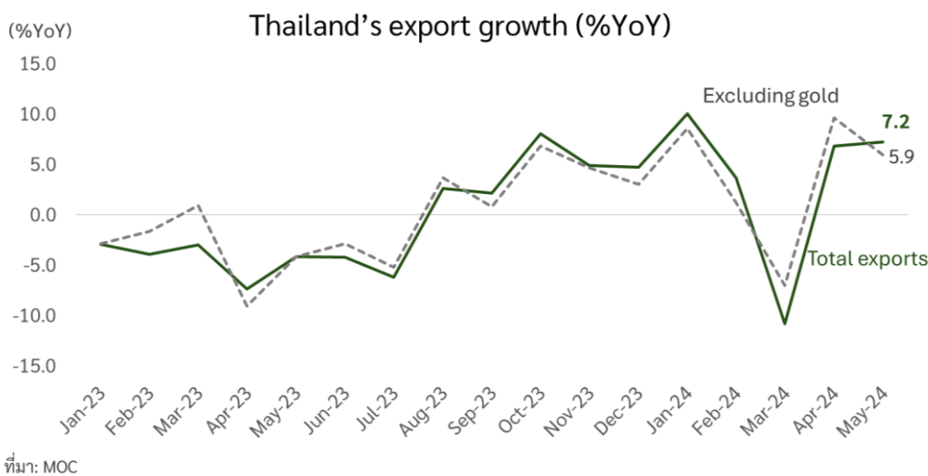
รูปที่ 2 ทุเรียนมีส่วนสำคัญที่ช่วยให้การส่งออกไทยเดือนนี้ขยายตัว