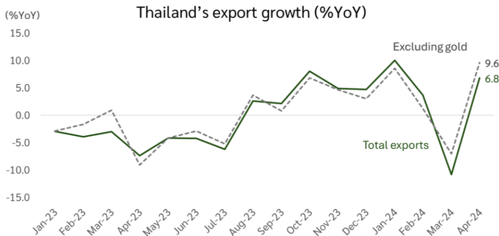
รูปที่ 1 การส่งออกเดือนเม.ย.67 กลับมาขยายตัว