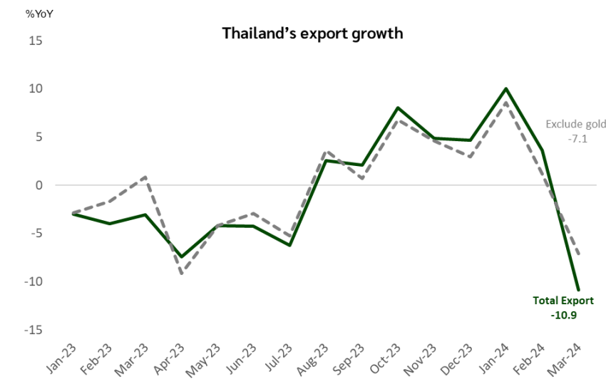
รูปที่ 1 การส่งออกของไทยในเดือนมี.ค. 67 หดตัวเป็นครั้งแรกในรอบ 8 เดือนที่ 10.9%YoY