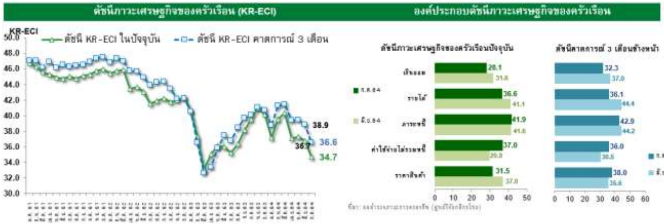
ดัชนีภาวะเศรษฐกิจของครัวเรือน ( KR Household Economic Condition Index หรือ KR-ECI) จัดทำขึ้นโดยศูนย์วิจัยกสิกรไทย เพื่อให้เป็นเครื่องชี้ที่สะท้อนความรู้สึกของครัวเรือนที่มีต่อการครองชีพทั้งในปัจจุบัน และในช่วง 3 เดือนข้างหน้า โดยค่าดัชนีที่สูงกว่าระดับ 50 หมายถึง ครัวเรือนส่วนใหญ่มองว่า ภาวะการครองชีพ “ดีขึ้น” ในทางตรงกันข้าม ค่าดัชนีที่ต่ำกว่าระดับ 50 หมายถึงภาวะการครองชีพ “แย่ลง” หมายเหตุ: ศูนย์วิจัยกสิกรไทยขยายขอบเขตการสำรวจภาวะเศรษฐกิจของครัวเรือนไปยังส่วนภูมิภาค (ต่างจังหวัด) ตั้งแต่วันที่ 1 กันยายน 2560 เป็นต้นไป

63 ที่มีการล็อกดาวน์ทั่วประเทศที่ 35.1 ขณะที่ดัชนีภาวะเศรษฐกิจและการครองชีพของครัวเรือนใน 3 เดือนข้างหน้าปรับตัวลดลงเช่นกันอยู่ที่ 36.6 จาก 38.9 ในเดือนมิ.ย. สะท้อนว่าครัวเรือนยังมีความวิตกกังวลต่อภาวะเศรษฐกิจและการครองชีพต่อเนื่อง โดยเมื่อพิจารณาองค์ประกอบของดัชนีพบว่าครัวเรือนมีความกังวลเพิ่มขึ้นเกี่ยวกับระดับราคาสินค้า โดยในเดือนก.ค.ดัชนีปรับลดลงอยู่ที่ 31.5 จาก 37.0 ในเดือนมิ.ย. ซึ่งเป็นไปในทิศทางเดียวกับระดับอัตราเงินเฟ้อของไทยในเดือนก.ค.ที่ผ่านมาที่ปรับเพิ่มขึ้นต่อเนื่องอยู่ที่ 0.45% ซึ่งหากไม่รวมผลจากมาตรการภาครัฐในเรื่องของการบรรเทาค่าใช้จ่ายด้านค่าน้ำค่าไฟระดับอัตราเงินเฟ้อจะเพิ่มสูงขึ้นถึง 1.8% โดยปัจจัยหนุนเงินเฟ้อนอกจากราคาน้ำมันแล้วส่วนหนึ่งมาจากราคาอาหารสดที่ปรับเพิ่มขึ้นตามความต้องการที่เพิ่มขึ้นในช่วงที่มีการล็อกดาวน์ ขณะที่กำลังซื้อของภาคครัวเรือนยังคงถูกกดดันจากความเปราะบางของฐานะการเงินที่สะสมมาจากการแพร่ระบาดในปีก่อนและปัจจุบันยังไม่สามารถฟื้นตัวได้สะท้อนผ่านนี้ครัวเรือนที่อยู่ในระดับสูงที่ 90.5% ของจีดีพีในไตรมาสแรกของปี 2564 นอกจากนี้ ครัวเรือนยังมีความกังวลเกี่ยวกับรายได้และจ้างงานเพิ่มขึ้น